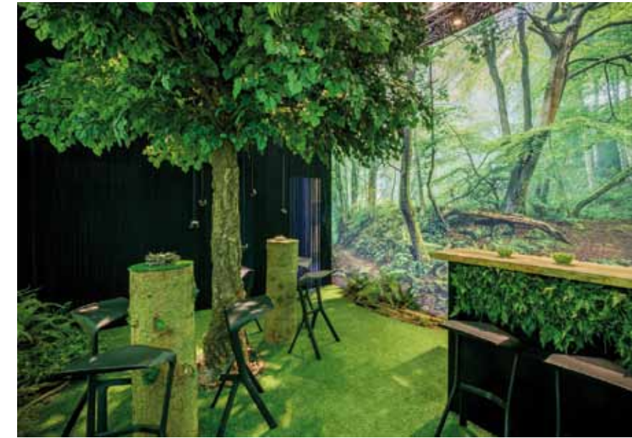
A large-scale banner with an Earl King design encompassed the 75 m 2 stand, symbolising the topic booth building 4.0 and thus the relationship between real and virtual worlds at trade exhibitions.