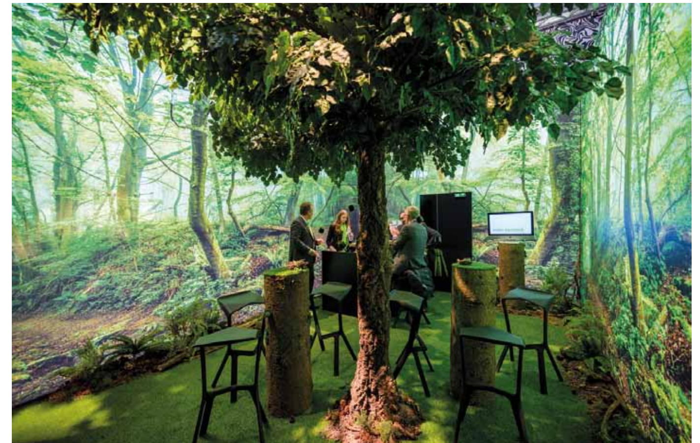
Size 75 m 2 | Exhibitor Atelier Damböck Messebau GmbH, Neufinsing | Photos Stefan Röhrler / modul A . pictures for your image, Leopoldshöhe; Atelier Damböck Messebau GmbH | Architecture / Design Atelier Damböck Messedesign GmbH | Others as systems GmbH, Markt Einersheim (Water wall)